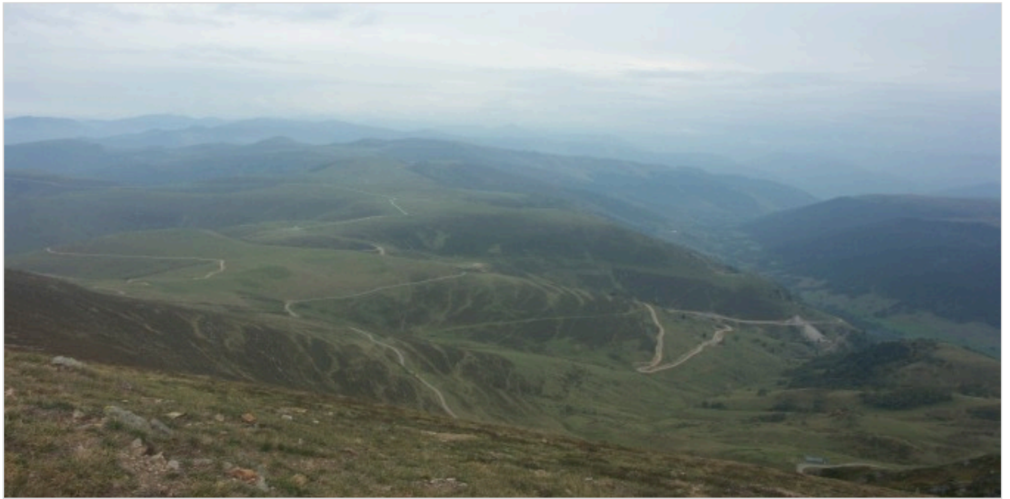
Groupement Pastoral du Mont-Né. Vue depuis le Mont-Né sur les estives